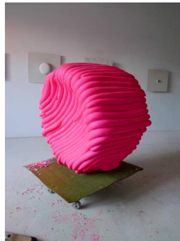
Verdemar (2014), Muestro lo que no ves (2014) i El dur treball del fracàs (2015).

Enrique Juncosa, museòleg, escriptor i crític d'art, traça en el catàleg que acompanya l'exposició que avui s'inaugura al Museu Can Mario de la Fundació Vila Casas, un relat vital i creatiu de la trajectòria d'un autor format a l'Escola Massana de Barcelona a finals dels anys 70, seduït per la corporeïtat de la forma gràcies a la irrupció del post minimalisme. És cap als anys 80, com assenyala Juncosa, que l'artista dóna forma, ja no només al material, sinó a un gest que li és propi i característic; la “forma trobada” –i trobada en els objectes més inesperats del nostre esdevenir contemporani, aquells on el joc n'és l'element rei (joguines, laminadures, objectes de consum inofensius i banals)– propicia una relació de mal·leabilitat que desafia l'impacte visual de la gamma cromàtica i ofereix una experiència de contemplació igual de llaminera i juganera –potser no del tot inofensiva.