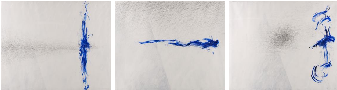
Tríptic del poeta I, II i III (2013).

Vaccaro, va escriure l'escriptor i periodista Francesc Miralles en un article molt complet sobre l'artista i la seva obra, el 1995, és nascut a Barcelona el 1946 i va formar-se a l'Escola Massana de Barcelona. Practicà el dibuix al natural al Cercle Artístic de Sant Lluç. La seva trajectòria començà cap als 70, al taller de Picasso a Barcelona, amb la combinació entre la tasca expositiva i el treball per a cobertes de discos i llibres, col·laboracions en obres de teatre i espectacles musicals i intervencions urbanístiques a l'àrea metropolitana de Barcelona.