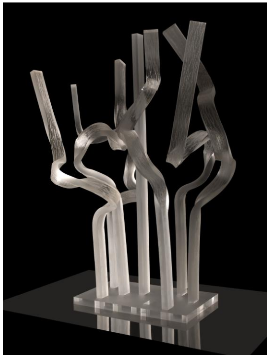
El bosc de l'ànima (2013).