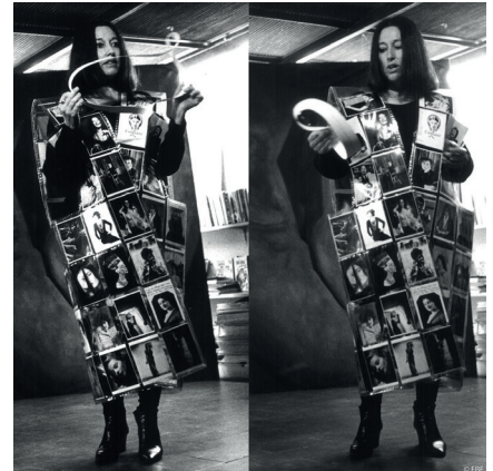
Àlbum portàtil, 1993

A l'exposició, breus cites de Virginia Woolf assenyalen el recorregut com una petita llanterna de butxaca.