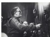
Álvarez del Vayo en un miting 1937 30 x 40 cm