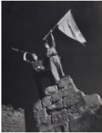
Monte Aragon S/d 30 x 40 cm