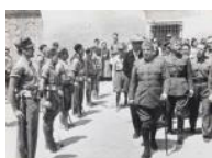
General Pozas passant revista al front d'Aragó 1937 30 x 40 cm