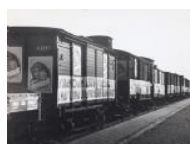
Ajuda catalana a Madrid S/d 30 x 40 cm