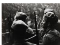
Soldats en un míting S/d 30 x 40 cm