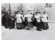
Processó religiosa, Bisbat S/d 30 x 40 cm