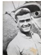
El Diable Roig al front d'Aragó 1936 40 x 30 cm