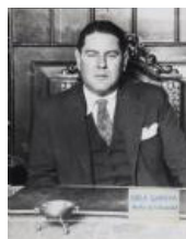
El Rector de la UB, Pere Bosch i Gimpera S/d 40 x 30 cm