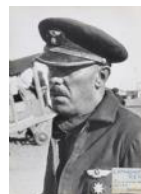
El Comandant Reyes a Sarinyena S/d 40 x 30 cm