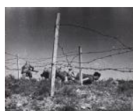
Escena del front d'Aragó II S/d 24 x 30 cm