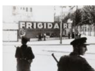
Primers incidents de la guerra 1936 30 x 40 cm