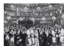
Jocs Florals al Palau de la Música 1935 29 x 40 cm