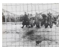
Fotomuntatge del camp de Bram 1939 30 x 40 cm