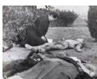
Mare i fill després del bombardeig de Lleida 1937 24 x 30 cm