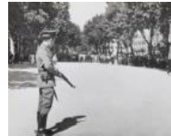
La Rambla durant els Fets d'Octubre 1934 30 x 40 cm