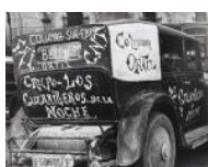
Els Guerrilleros de la Noche al front d'Aragó S/d 24 x 30 cm