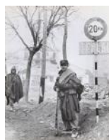
Milicià després de la presa de Terol c.1938 30 x 24 cm