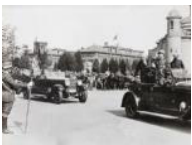
Arribada de Francesc Macià a la Ciutadella 1931 30 x 40 cm