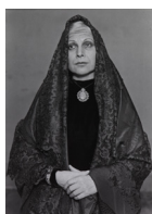
Margarida Xirgu 1935 40 x 30 cm