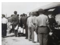
Internats fent cua per rebre aliments (Bram) 1939 30 x 40 cm