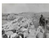
Soldat i pastor S/d 30 x 40 cm