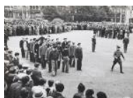
Voluntaris en formació militar S/d 30 x 40 cm