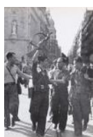
Sortida de la Columna Garcia Oliver 1936 30 x 24 cm