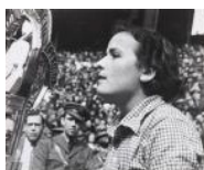
Una jove Teresa Pàmies en el míting de la dona Antifeixista 1937 24 x 30 cm