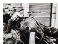
Guàrdies d'assalt al carrer Diputació 1936 30 x 40 cm