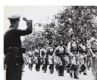
L'Exèrcit Popular desfilant S/d 24 x 30 cm