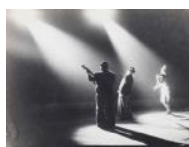
Pallassos Antonet i Baby al Circ Olimpia S/d 30 x 40 cm