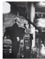
El violoncel·lista Pau Casals al Liceu 1938 40 x 30 cm