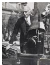
Arribada de Francesc Macià a la Ciutadella (detall) 1931 40 x 30 cm