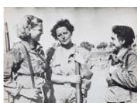
Grup de milicianes S/d 30 x 40 cm