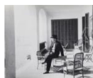
Pau Casals descansant a la casa familiar S/d 30 x 40 cm