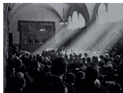
Reunió de les Corts republicanes 1938 Còpia digital 30 x 40 cm