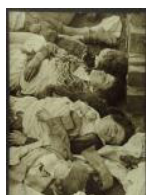
Victimes del bombardeig de Lleida 1937 40 x 30 cm