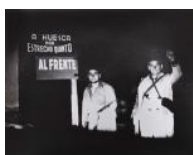
Control nocturn al front d'Aragó S/d 24 x 30 cm