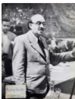
El filòsof Jaume Serra Hunter 1937 40 x 30 cm