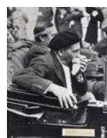
Retorn del President Companys a Barcelona procedent del penal del Puerto de Santa María II 1936 40 x 30 cm