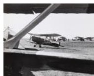
Camp d'aviació Albalatillo S/d 24 x 30 cm