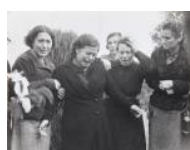
Bombardeig de Lleida S/d 30 x 40 cm