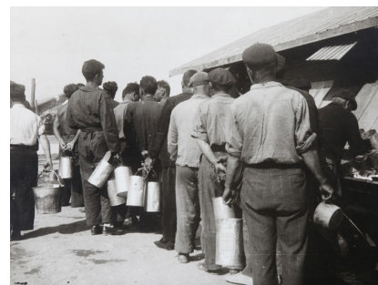
Internats fent cua per rebre aliments 1939 Còpia d'autor 30 x 40 cm

En el darrer àmbit, l'exposició acull, per primera vegada, les 35 fotografies positivades per Sergi Centelles, fill del fotògraf, a partir de negatius que no havien estat revelats per l'artista. Entre aquestes peces mai exposades, s'hi poden veure retrats de personatges històricament rellevants com per exemple la imatge on surten Azaña, Marquina i Pi Sunyer junts a Port de la Selva, moments cabdals com l'enterrament del sindicalista i anarquista Buenaventura Durruti o el Consell de Ministres a Montserrat, però també imatges populars com les atraccions de La festa major de la Barceloneta o una representació de l'obra Bodas de sangre de García Lorca protagonitzada per Margarida Xirgu.