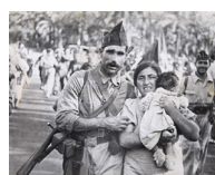
un milicià amb la seva família S/d 24 x 30 cm