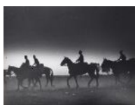
Escena del front d' Aragó I S/d 30 x 40 cm