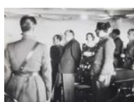
Judici als generals Goded i Burriel 1936 30 x 40 cm