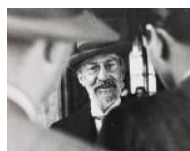
Diputat Ramon d'Abadal S/d 24 x 30 cm