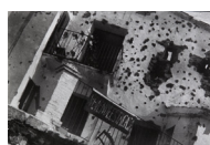
Front d'Aragó S/d 30 x 40 cm