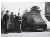
Els president Azaña i Companys inspeccionant una mostra de material bèl·lic S/d 30 x 40 cm