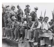
Trasllat de tropes al front Aragó S/d 24 x 30 cm