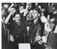
Boda de milicians 1936 24 x 30 cm