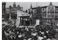
Guerrillas del Teatro (Plaça Catalunya, Barcelona) 1938 30 x 40 cm