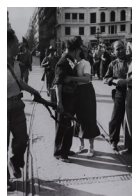
Sortida de la Columna Los Aguiluchos 1936 40 x 30 cm