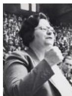
Federica Montseny en un míting S/d 40 x 30 cm