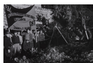
Enterrament de Buenaventura Durruti 1936 30 x 40 cm