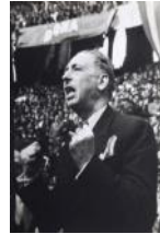
El president Companys en el míting de la Dona Antifeixista 1937 30 x 40 cm