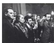
La Pasionaria en el miting del PSUC celebrat a Barcelona 1937 30 x 40 cm