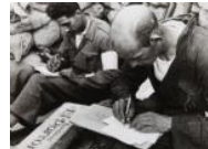
Carta per casa al front S/d 30 x 40 cm