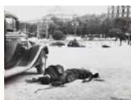
Primers morts civils 1936 30 x 40 cm