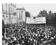
Manifestació de rabassaires davant del parlament de Catalunya 1934 24 x 30 cm