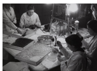
Tècniques treballant al Laboratori Municipal 1936-1937 30 x 40 cm