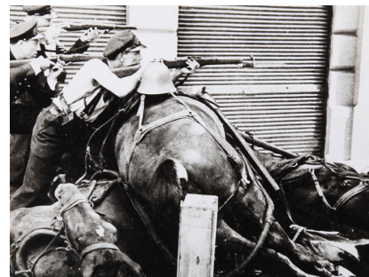
Guàrdies d'assalt al carrer Diputació 1936 Còpia d'autor 30 x 40 cm