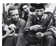
La Guardia Civil confraternitza amb el poble S/d 24 x 30 cm