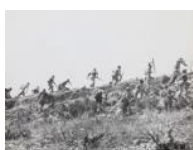
Escena de front d' Aragó III S/d 30 x 40 cm