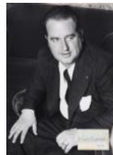
L'Alcalde de Barcelona Hilari Salvador 1937 40 x 30 cm