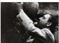
El president Companys al front d'Aragó 1937 30 x 40 cm