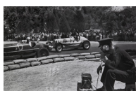
II Copa Barcelona d'automobilisme al Circuit de Montjuïc 1934 30 x 40 cm