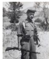
El Negus de Tardienta S/d 40 x 30 cm