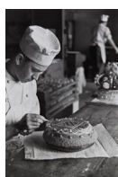
Rebosteria de Pasqua 1936 30 x 40 cm