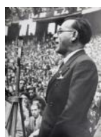
Comorera participant en un míting 1937 40 x 30 cm