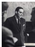
El conseller Tarradellas S/d 40 x 30 cm