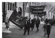
Desfilada del batalló Abraham Lincoln 1937 30 x 40 cm