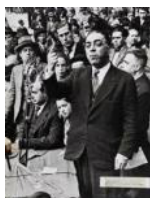
El president Casanovas S/d 30 x 40 cm