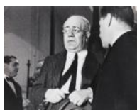
El president Azaña S/d 24 x 30 cm