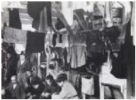
Amics de Centelles en el seu barracó (Bram) 1939 30 x 40 cm