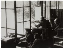
Defensa de l'edifici de Telefónica 1936 30 x 40 cm

95 còpies d'autor, positivades per Agustí Centelles entre 1976 i 1979, que la Fundació Vila Casas va adquirir l'any 2010 i que formen part de l'exposició.