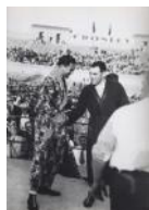
Combat entre Uzcudun i Schmeling 1934 30 x 40 cm