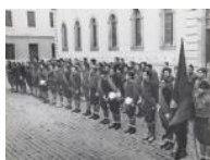
Voluntaris a la Caserna Lenin de Barcelona S/d 30 x 40 cm