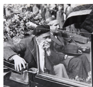
Retorn del president Companys a Barcelona procedent del penal de Puerto de Santa Maria I 1936 24 x 30 cm