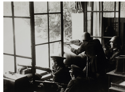
Defensa de l'edifici de Telefónica 1936 Còpia d'autor 30 x 40 cm

En tota la seva trajectòria, s'hi pot veure el llenguatge propi que Centelles va desenvolupar ja els primers anys com a professional. Marcat per una forta intuïció, el fotògraf era capaç d'avançar-se als esdeveniments i centrar-se en allò essencial, tot defugint l'anècdota per transmetre la notícia. En un context en què l'enginyeria fotogràfica havia assolit fites instrumentals decisives, com per exemple la sortida al mercat de la càmera Leica, l'artista va saber aprofitar els avenços d'aquesta màquina per fugir de les panoràmiques frontals i estàtiques i endinsar-se en el moviment, més proper al cinema que tant li interessava.