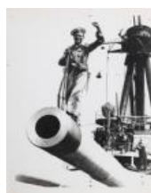
El Vaixell Jaume I al Port de Barcelona S/d 40 x 30 cm