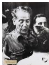
El Coronel Pérez Farràs 1936 40 x 30 cm