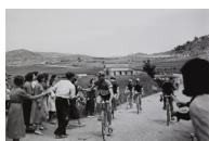
Avituallament durant la Volta a Catalunya 1936 30 x 40 cm