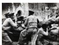
Barricada a Belchite I S/d 30 x 40 cm