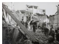
Efectes del bombardeig de Lleida 1937 30 x 40 cm