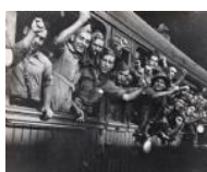
Sortida de milicians 1936 24 x 30 cm