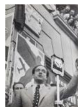
El dirigent de la CNT, Joan Garcia Oliver 1937 40 x 30 cm