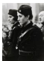
Milicians en un míting S/d 30 x 40 cm