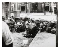
Barricada al carrer del Tigre 1936 30 x 40 cm