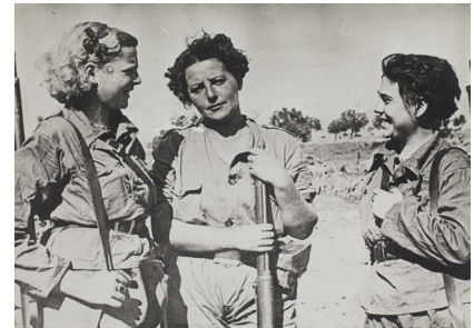
Grup de milicians S/d Còpia d'autor 30 x 40 cm

L'exposició se centra en les dues primeres etapes de la trajectòria de l'artista: una primera, de consolidació de les bases del seu treball fotogràfic com a reporter d'esdeveniments esportius, retrats o actes populars, i una segona, en la qual el fotògraf es converteix en cronista de guerra tot retratant la tragèdia en què es veu immers el país. Segons Giralt-Miracle, tant l'obra que va desenvolupar durant aquestes dues etapes com la que va dur a terme a la darrera, de fotògraf publicitari, està marcada per la suma de tres elements fonamentals: " l'instint periodístic, la intel·ligència visual i el fet de tenir un instrument idoni com la Leica ".