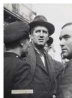
L'alcalde de Barcelona, Carles Pi i Sunyer, visitant l'efecte de les bombes a la Barceloneta 1937 40 x 30 cm