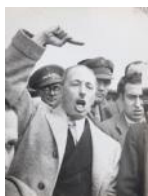
El president Companys pronunciant un discurs a Pins del Vallès 1937 40 x 30 cm