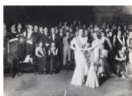
Proclamació de Miss Catalunya 1935 30 x 40 cm