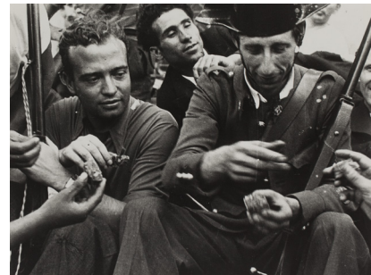
Confraternització entre milicians i guàrdia civil 1936 Còpia d'autor 24 x 30 cm

L'any 1976, després de la mort de Franco, Centelles recupera l'arxiu que havia estat amagat a França i, de tornada a Catalunya, esdevé el primer espectador de la seva pròpia obra. En aquell moment el fotògraf sent la necessitat d'analitzar els fets ocorreguts abans i durant la guerra i positiva els negatius bo i atorgant-los, en alguns casos, un nou enquadrament que li permetrà d'emfatitzar nous aspectes gràcies a la perspectiva del temps. Així mateix, les 95 còpies d'autor –d'un total de 145 que conformen la col·lecció– que es poden veure en aquesta exposició compten amb anotacions manuscrites i mecanoscrites en la cara o en el dors.