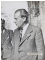
El diputat Martí Barrera 1937 40 x 30 cm