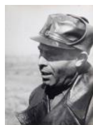
Durruti a Sarinyena I 1936 40 x 30 cm