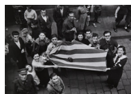
Recapta popular en ajuda a Madrid S/d 30 x 40 cm