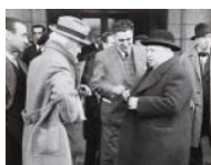
Portela Valladares e Indalecio Prieto S/d 24 x 30 cm