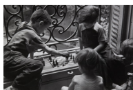
Residència per a nens refugiats núm. 32, Nadejda Krúpskaia 1937 30 x 40 cm