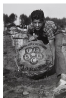
Mataró Potatoes 1937 30 x 40 cm