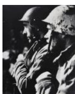
Soldats en un miting polític S/d 30 x 40 cm