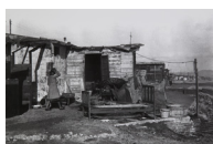
Barraques al barri de Somorrostro 1934-1936 30 x 40 cm