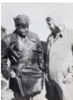
Durruti, Albalatillo S/d 30 x 40 cm