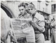
Soldats llegint la premsa a Alcanyís S/d 30 x 40 cm