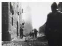
Siéamo ocupat 1936 30 x 40 cm