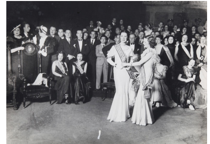
Proclamació de Miss Catalunya 1935 Còpia d'autor 30 x 40 cm

Seguint el recorregut expositiu, a continuació se'ns mostren les obres que el fotògraf va fer dels fets del 19 de juliol i de l'inici de la Guerra Civil. Aquest moment coincideix amb el punt més àlgid de la seva carrera, en què era un fotògraf de reputació que col·laborava amb les agències AP, Havas, Fulgur o Keystone. El 19 de juliol i els dies posteriors, de plena revolució i ebullició social, Centelles capta algunes de les imatges més reproduïdes de la seva