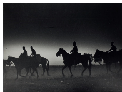
Escena del front d'Aragó 1936 Còpia d'autor 30 x 40 cm