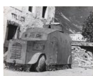
Tanc averiat a Biescas S/d 24 x 30 cm