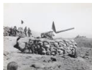
Bateria antiaèria al front d'Aragó 1936 30 x 40 cm