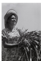
Sega del blat a Juneda, Les Garrigues 1936-1938 30 x 40 cm