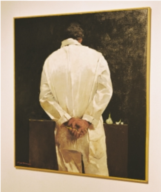
Artista observando vegetal 1999