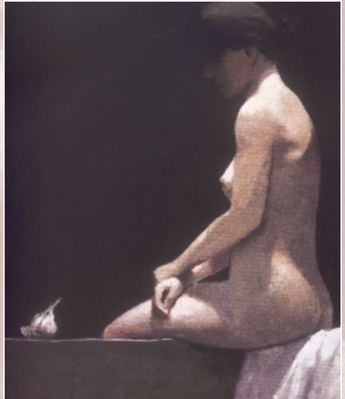
Desnudo observando vegetal 1999

El debate QUIRAL ARTE en torno a Macaya nos parece un fiel reflejo de un artista que, a través de su singular interpretación de la luz y el claroscuro, consigue dar al oficio pinceladas de vida, con gusto personal y que resulta del agrado del coleccionista.