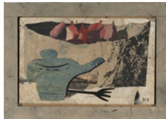
Miguel Rasero S/t (natura morta) 1995 Tècnica mixta sobre fusta 25 x 39 cm