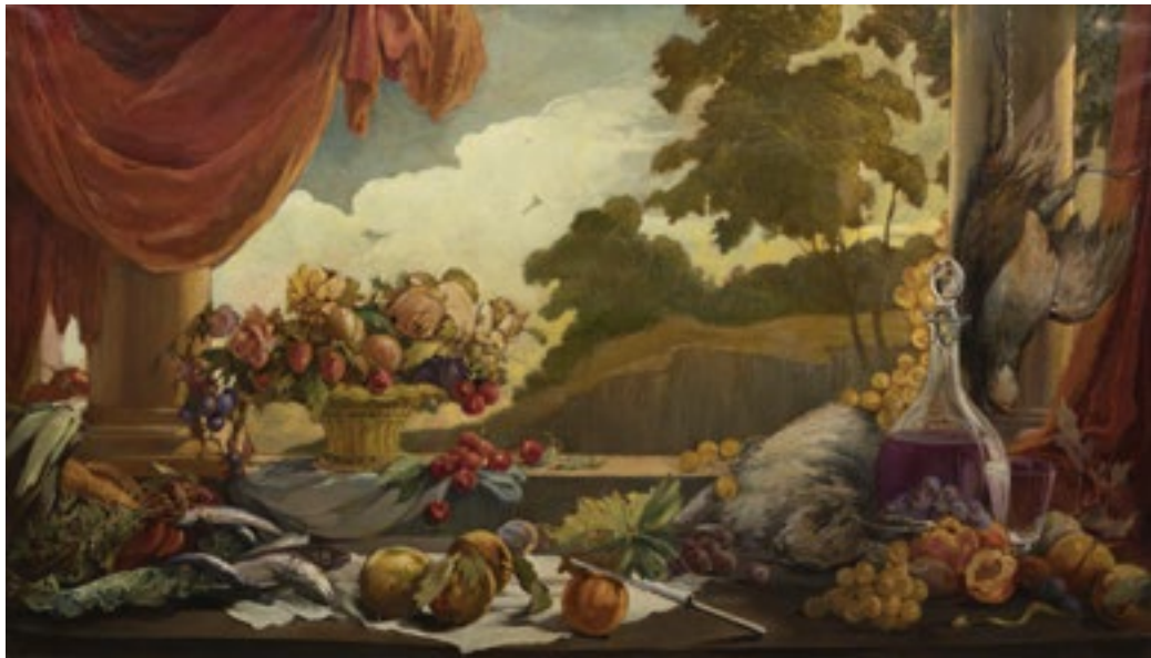
Adrià Gual S/t 1940 Oli sobre tela 68 x 117 cm