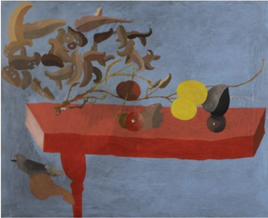
Jorge Castillo S/t S/d Acrílic sobre tela 80 x 100 cm