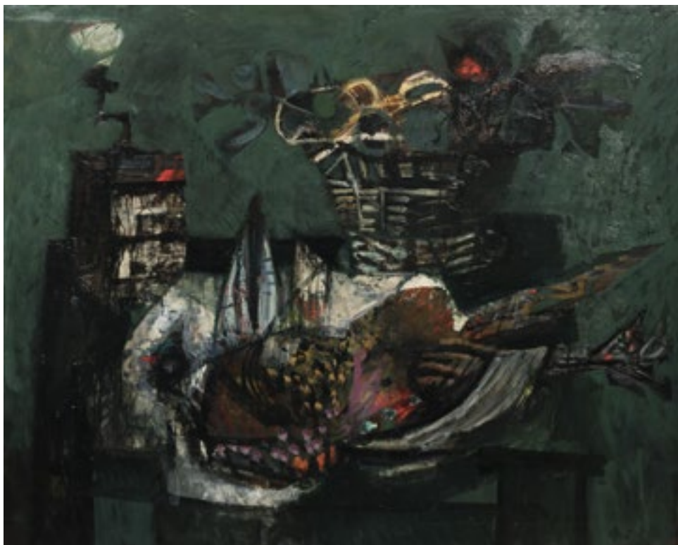
Antoni Clavé S/t S/d Oli sobre tela 80 x 100 cm