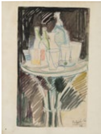
Ramon Aguilar Moré Vermut 1948 Dibuix amb llapis de colors i pinzellades de guaix sobre paper 30 x 18 cm

© Antoni Clavé, Jorge Castillo, Xavier Valls i Ramon Aguilar Moré, VEGAP, Barcelona 2017