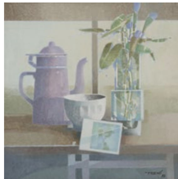
Francesc Todó Amb cafè de Colòmbia 1993 Oli sobre tela 60 x 60 cm