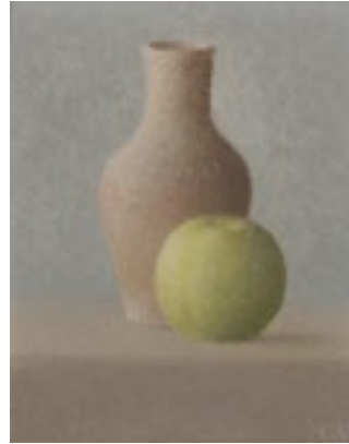
Xavier Valls S/t 1974 Oli sobre fusta 27 x 22 cm