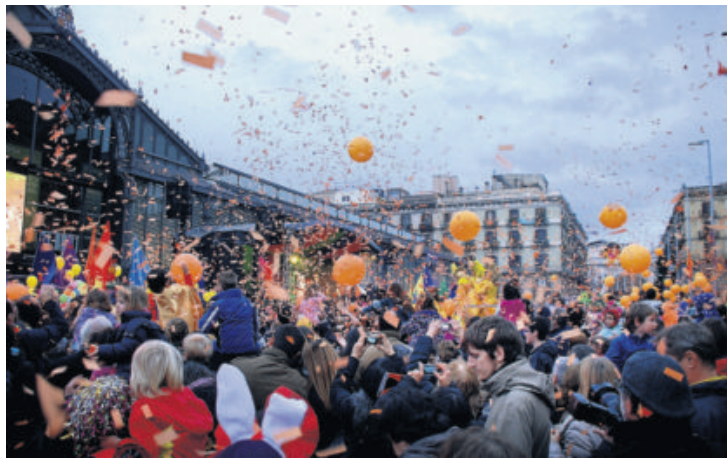
Els gegants ballaran al Born —l'any passat ja va ser escenari— en honor del Rei Carnestoltes.

► Lleida. El veritable protagonista de la festa lleidatana no serà Carnestoltes, sinó Pau Pi, figura històrica del carnaval de la ciutat, que serà l'encarregat