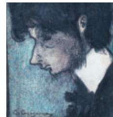
Autoretrat de Casagemas.

MNAC presenta 13 pintures inèdites, segons el comissari Eduard Vallès, "perquè no s'han exposat mai". Entre elles la seva primera obra, Marina , que conserva la família del pintor, o El mercat , una de les obres que va guardar Picasso tota la vida.