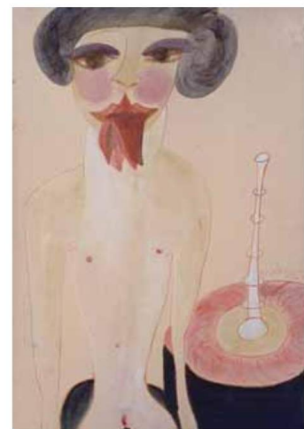
El Gran Canyó, vist per Sebastião Salgado (a dalt, a l'esquerra), i, a la dreta, 'Donna en un café', de Charles Casagemas. Al costat, 'Opera 54', de Carol Rama.