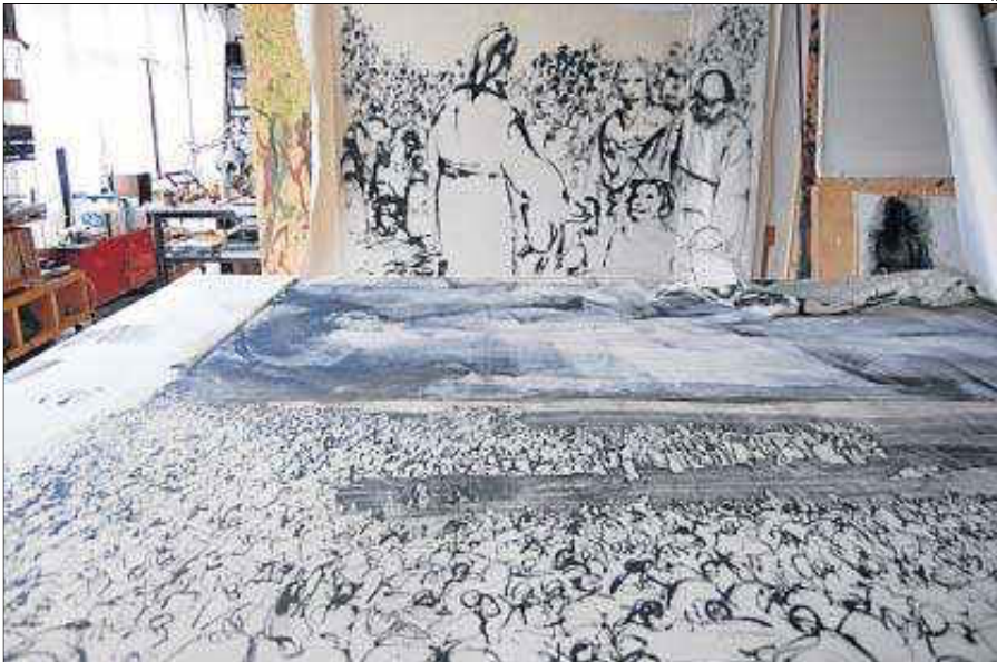
El maná en primer plano y fragmento de la multiplicación del milagro de los panes y los peces en el fondo.