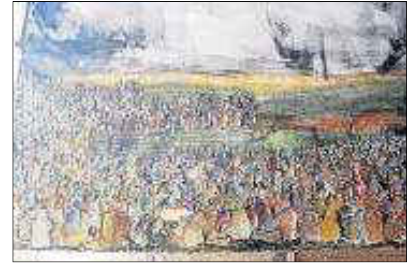
Evolución de varias escenas que representan el maná en la pintura de 2,50 metros que está preparando Perico Pastor para el templo.