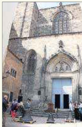
Basílica de Sant Just i Pastor.

La basílica dels Sants Màrtirs Just i Pastor está en la plaza homónima en el Barri Gòtic de Barcelona. La tradición la sitúa como una de las más antiguas de la capital, y apunta a que el actual edificio estaría construido sobre restos de dependencias episcopales del siglo IV. Lo que sí que está comprobado es que su interior repasa la historia de Barcelona. La parte principal de la iglesia se construyó entre 1342 y 1574, en diferentes fases, aunque un sector está documentado de 801. Cuenta con una nave rematada con un ábside y 6 capillas entre los contrafuertes, entre ellas la de la Eucaristía,