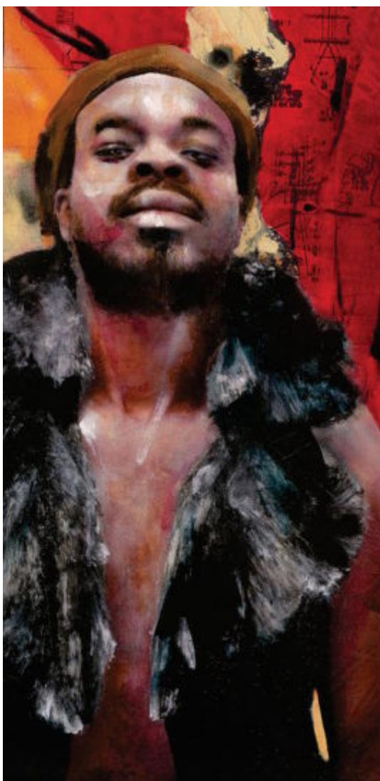
Coruña: "Yerry", 215 x 145 cm (izqda.) y "Ray", 215 x 145 cm (dcha.).

R. Sí, se inaugura con 15 días de diferencia respecto a Testimonio y va a ser muy interesante, porque ahí enseño el periodo en que pintaba el músculo. Yo ahora pinto la piel, lo bonito, lo que es visible, pero hubo un periodo, que se verá en Vila Casas, en que pintaba el músculo, un periodo muy duro, desgarrador. Poco a poco vas evolucionando y vas encontrando paz con el mundo, con los colores, con las formas, con tu vida... Pero crecer duele.