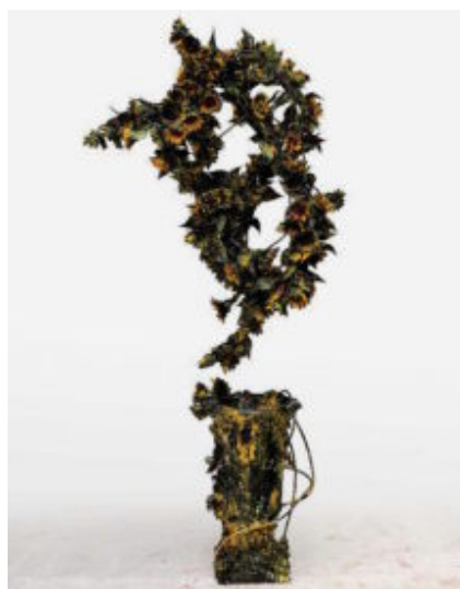
RETROSPECTIVA. "Persistence", instalación de flores (2016), 240 x 140 x 30 cm, es una de las obras que viajarán a Barcelona.

"La soledad. Pero no la soledad de no estar acompañada, sino de no sentirme conectada con la vida, aislada de los sentimientos, la falta de libertad de pensamiento, las cárceles mentales... Eso me da un miedo terrorífico"