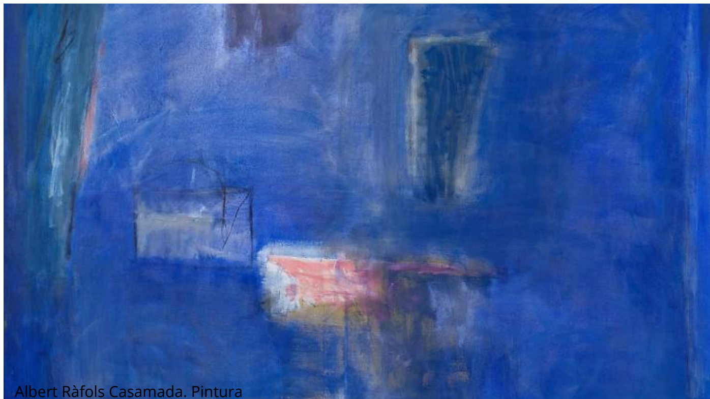
Albert Ràfols Casamada. Pintura